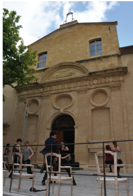
Représentation du G.U.I.D. devant la chapelle des Pénitents blancs

★ Tout au long de la soirée, sur les deux sites : « Granet XX e », chapelle des Pénitents blancs, Saint Jean de Malte.