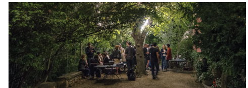
© Carlos Castelleira - ESAAix 2014.

La Lumière baigne l'oeuvre de Cézanne, et sera au coeur des visites dans son atelier. Cette année, la compagnie Les Cubiténistes viendra photographier les visiteurs de façon insolite. Chaque portrait sera ensuite imprimé, et marouflé sur des palissades, pour créer des tableaux à l'image d'une soirée conviviale.