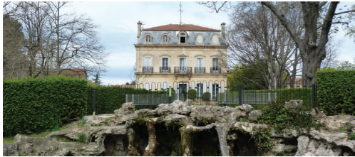
Bastide du parc Saint-Mitre.